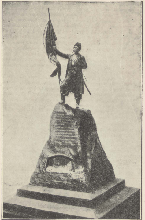
Monument élevé en 1912 à Ekaterinodare par l'armée cosaque du Kouban aux Zaporogues, colonisateurs de ce pays.