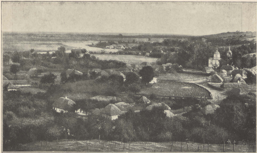
Un village ukrainien en Volhynie.